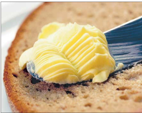
Von wegen fett. Margarine verspricht längst, den Cholesterinspiegel zu senken. Laut einer Umfrage können sich sechs von zehn Verbrauchern vorstellen, Lebensmittel mit Zusatznutzen zu kaufen.

onsforschung in Karlsruhe. „Von Scharlatanerie bis hin zu wirklich wirksamen Produkten reicht das Angebot.“ Leider sei dies für den Verbraucher nicht erkennbar. So heißt diesem nur, den Versprechungen der Hersteller zu glauben und sich bei den Verbraucherschutzzentralen zu erkundigen. Allgemein gilt: „Hersteller dürfen keine falschen Angaben machen“, sagt Lebensmittelexpertin Rams. So heißt es bei Unilever etwa, daß die Diät-Halbfettmargarine „Bece! pro-active“ helfe, das „schlechte“ LDL-Cholesterin um nachweislich 10 bis 15 Prozent zu senken.“ Bereits nach drei Wochen trete die Wirkung ein. Allerdings gebe es keine einheitlichen Regeln, sagt Rams, die erfüllt sein müssen, um solche Aussagen machen zu dürfen. Auf EU-Ebene wird derzeit noch an entsprechenden Vorschriften gearbeitet.